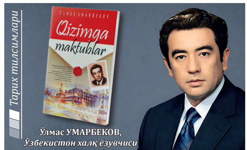
Ўлмас УМАРБЕКОВ, Ўзбекистон халқ ёзувчиси