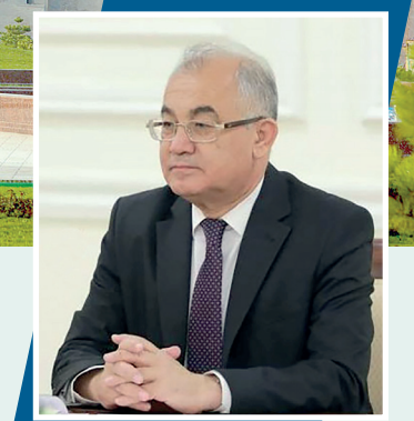
Акмал САИДОВ, Инсон ҳуқуқлари бўйича Ўзбекистон Республикаси Миллий маркази директори, академик