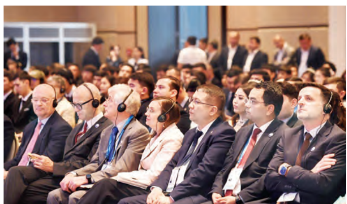
So'z – xalqaro anjuman ishtirokchilari

Sammit yakunida zamonaviy narkotahdidlarga qarshi kompleks yondashuvlar ishlab chiqilib, Markaziy Osiyo yoshlari tomonidan mintaqaviy davlatlarning sohaga oid faoliyat olib borayotgan rasmiylariga yo'llangan Yoshlar murojaati qabul qilindi.