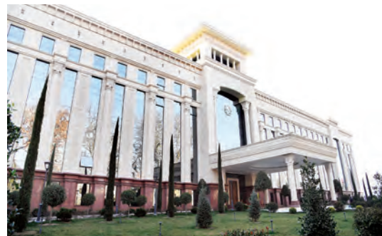
Tadbirda yil davomida O'zbekiston raisligi doirasida amalga oshiriladigan

ustuvor vazifalar atroflicha muhokama qilindi.