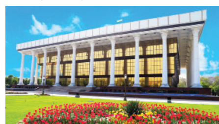
Oliy Majlis Qonunchilik palatasi

Oliy Majlis Qonunchilik palatasining Korruptsiyaga qarshi kurashish va sud-huquq masalalari qo'mitasi tomonidan Yangi O'zbekistonning sud islohotlari: ma'muriy sud adolati va barqaror davlat boshqaruvining kafolati masalalariga bag'ishlangan davra suhbatlari o'tkazildi.