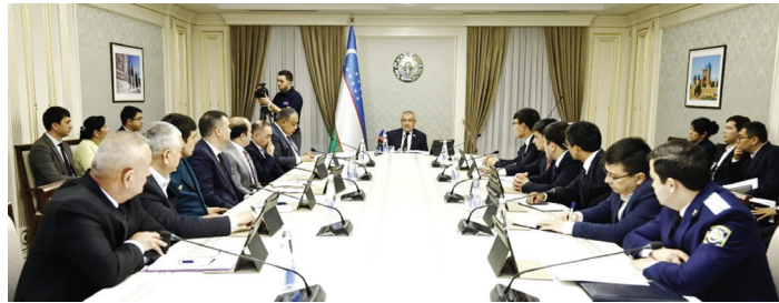
joy kommunal xo'jaligi sohasida nazorat qilish inspeksiya va xavfsizlik xizmatlarini qurilish sohasidagi davlat nazorati va boshqaruvi yanada takomillashtirish maqsadida ihot daraxtzorlari barpo etish ishlarini jadallashtirish, genetik resurslardan unumli foydalanish zarurligi ta'kidlandi.

Qonun bilan Jinoyat hamda Ma'muriy javobgarlik to'g'risidagi kodekslarga o'zgartirish va qo'shimchalar kiritilib, ko'p kvartirali uylarni Vazirlar Mahkamasi huzuridagi Qurilish va uy-