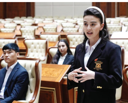
imkoniyatlari haqida tushunchalar berildi.

Unda talabalarga parlament yuqori palatasining asosiy vazifalari, ustuvor yo'nalishlari, senatorlarning qonun ijodkorligi va hududlar bilan ishlash jarayonlari haqida batafsil ma'lumot berildi. Shuningdek, Yoshlar parlamentining faoliyati, uning navjiron avlod manfaatlarini ifoda etishdagi o'rni hamda turli tashabbuslarni ilgari surishdagi