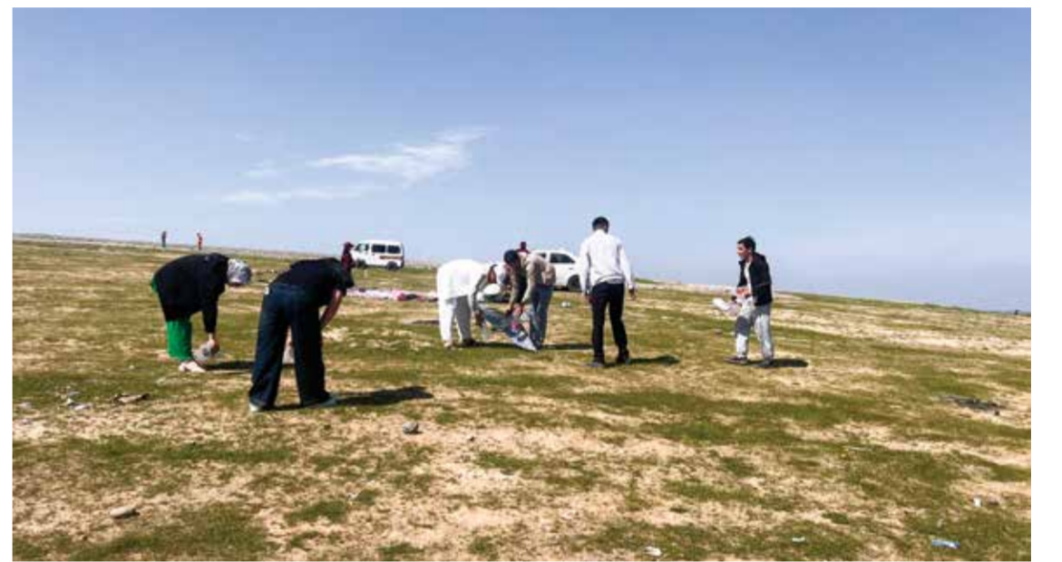
▲ Фарғона вилояти Кува туманидаги “Каркидон” дам олиш зонаси ҳудуди чиқиндилардан тазаланмоқда.

Унутмайлик, табиат биздан кўп нарса сўрамайди. Фақат озгина эътибор, ҳурмат ва меҳр кутади ҳолос. Шунга ҳам бера олмасак, унда табиатни ким эшитади?