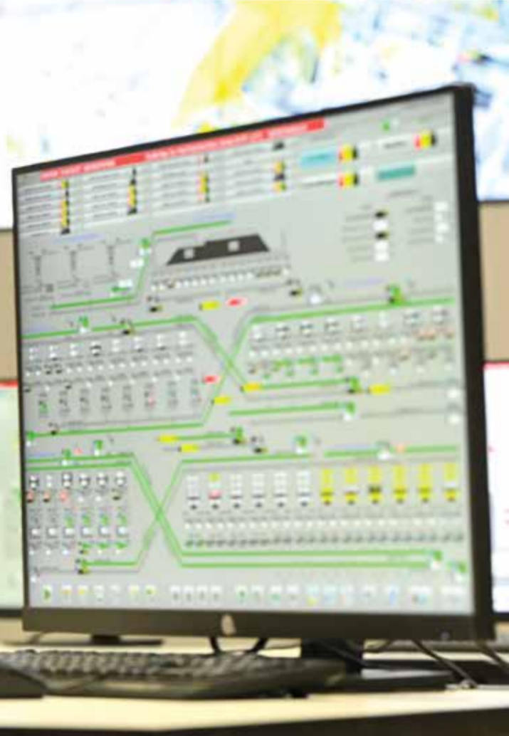
▲ Олмалиқ кон-металлургия комбинатида.