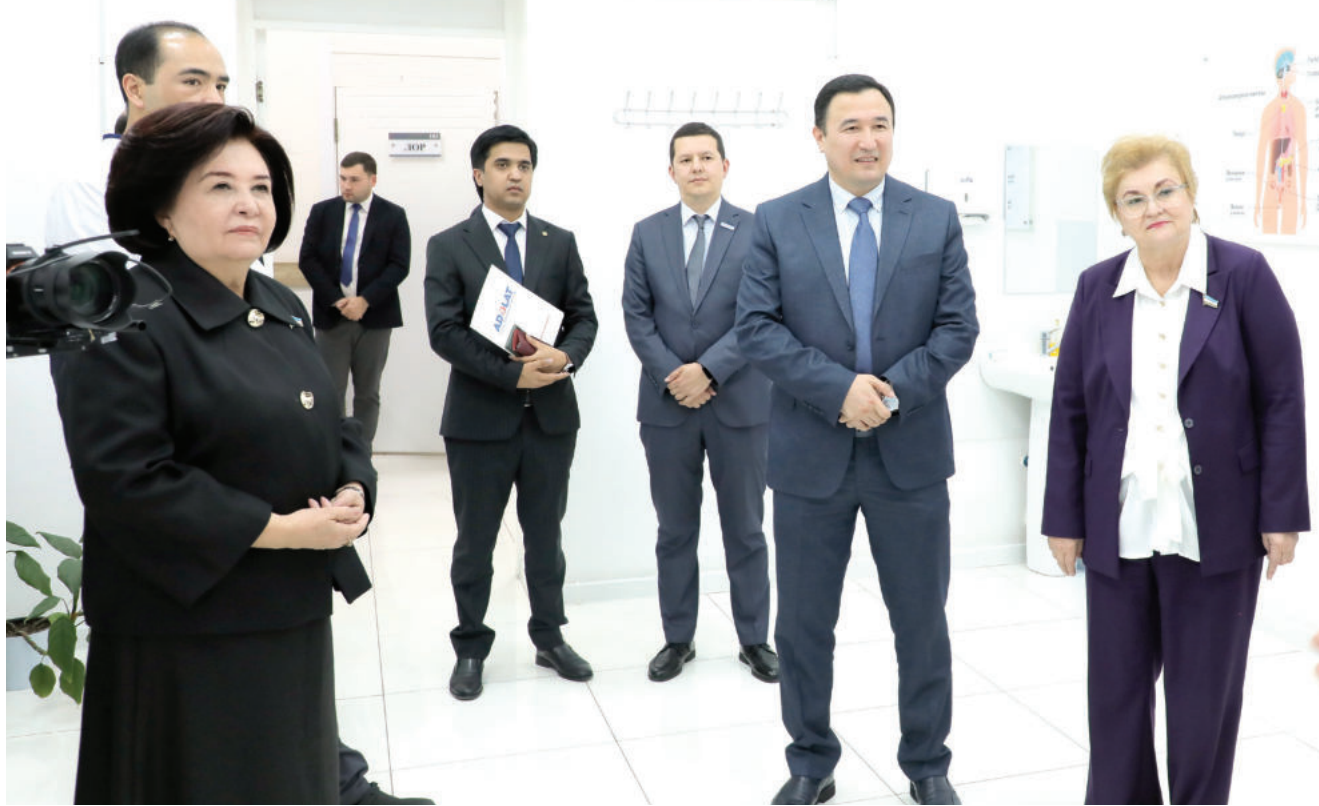
Робахон МАХМУДОВА, Олий Мажлис Қонунчилик палатасидаги "Адолат" СДП фракцияси раҳбари

Фидойилик, юрт тараққиётига дахлдорлик ва халқ вакиллиги масъулияти