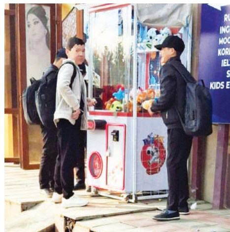
кан тадбиркорнинг иши барбод бўлмайди?

Интернетдаги маълумотларга кўра, автоматлар шундай созланганки, қисқич маълум ораликда, масалан, 10-15 мартаба ўйналгандан кейингина ўйинчоқни қаттиқ ушлайди. Бу гапнинг ҳақиқат экани, ҳусусан, аппаратларда техник жиҳатдан алдов механизми борлиги эҳтимолдан холи эмас. Йўқса, дуч келган одам 2 минг сўм пул солиб, бир ёки икки уринишда 15-20 минг, баъзан 30 минг сўмлик ўйинчоқларни ютиб кетаверса, сармоясини бу бизнесга тик-