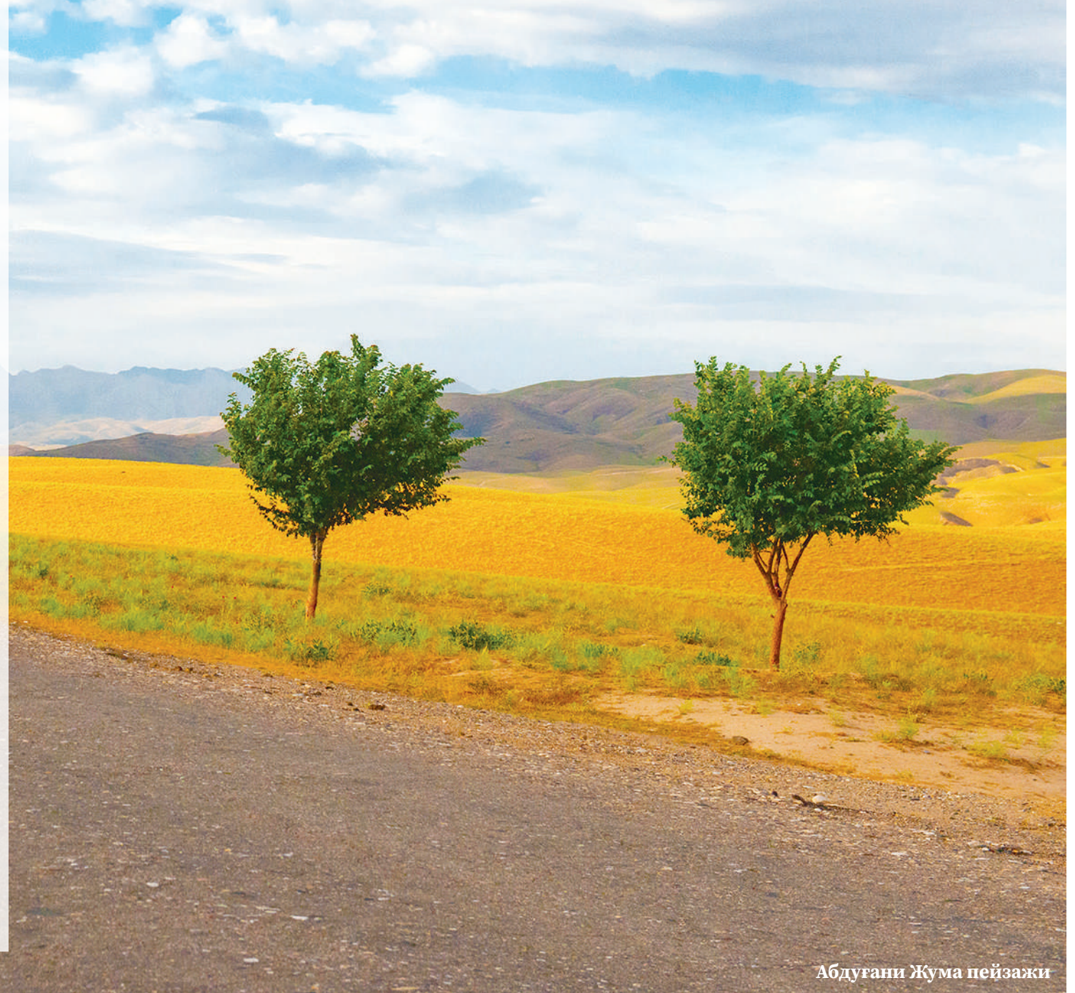
Абдуғани Жума пейзажи