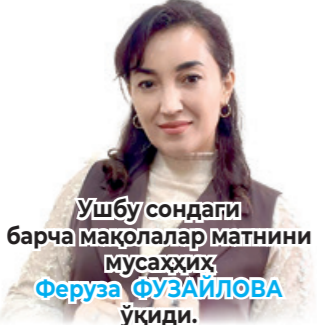
Ушбу сондаги барча мақолалар матнини мусахҳиҳ Феруза ҲУЗАЙЛОВА ўқиди.

Қинғир иши фош бўлиб, қонун олдида жавоб бериш пайти келганда дод-фарёд қилишга тушган она қайси қалб, қайси юрак билан ўз боласини пулга алмашди? Бунинг қандай сабаблари бор, бу бизга қоронғу. Лекин не бўлганда ҳам ҳеч бир сабаб уларнинг бу қилмишини оқламайди. Онага қўшилиб, ота ҳам жирканч савдога аралашгани янада аянчлидир.