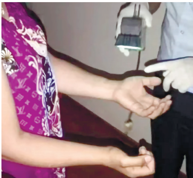
Фарғона вилояти ички ишлар бошқармаси ахборот хизмати.