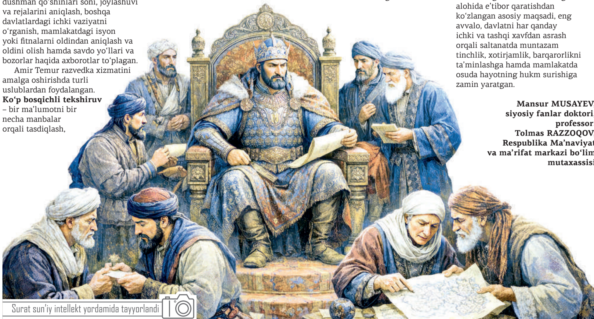
Surat sun'iy intellekt yordamida tayyorlandi