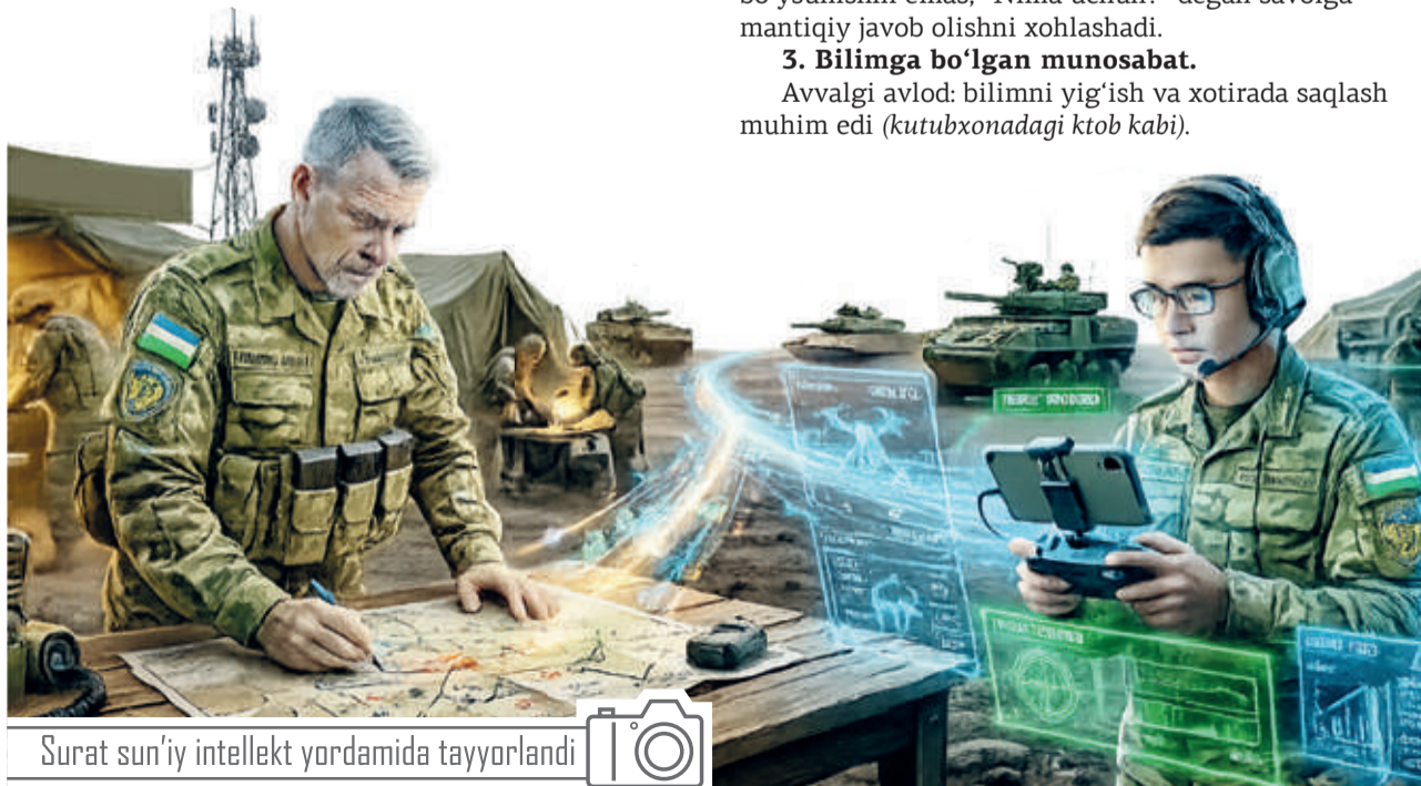
Surat sun'iy intellekt yordamida tayyorlandi

Harbiy xavfsizlik va mudofaa universiteti o'qituvchisi, tarix fanlari bo'yicha falsafa doktori