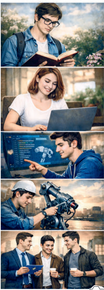
Surat sun'iy intellekt yordamida tayyorlandi