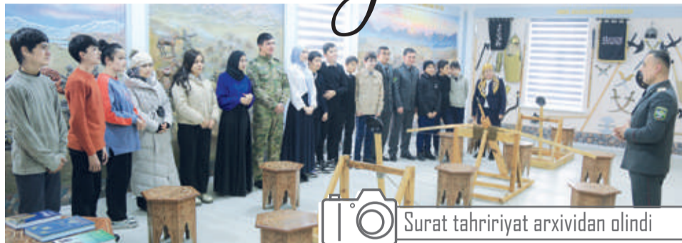
Surat tahririyat arxividan olindi

Mazkur yo'nalishda olib borilayotgan ishlar qamrovi keng bo'lib, unda yosh harbiy xizmatchilar bilan bir qatorda maktabgacha ta'lim tashkilotlari tarbiyalanuvchilari, o'quvchi va