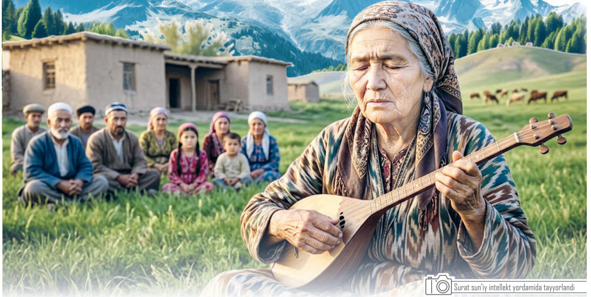
Surat sun'iy intellekt yordamida tayyorlandi

O'zbek folklorshunosligi tarixidan ma'lumki, Qashqadaryo viloyatining Dehqonobod, G'uzor, Shahrisabz, Qamashi tumanlarida xalq og'zaki ijodining asosiy yo'nalishi bo'lgan baxshichilik san'atining yirik maktablari shakllangan va faoliyat ko'rsatgan.