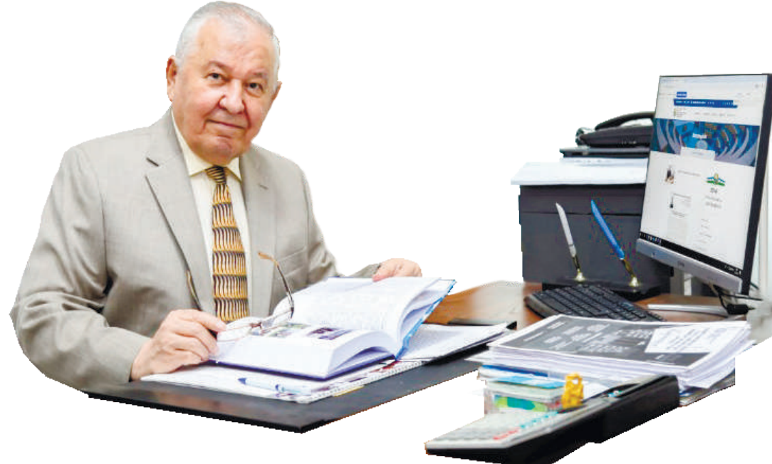
Ватан учун шунча яхши”, деб, мени ҳукумат ҳузуридеда Касб-хўнар таълими кўмитасига ишға ўтишимға буйруқ берди”...

Шундай қилиб, катта идорада иш бошладим. 1973 йил бошида Шароф Рашидов яна қақириб: “Сиз инженерсиз, Ўзбекистонға ишчи кадрлар етишмайди. Ёшларни инженерлик касбига жалб қиласиз, касбий таълимни ривожлантирасиз, қанча муҳандис кўп бўлса,