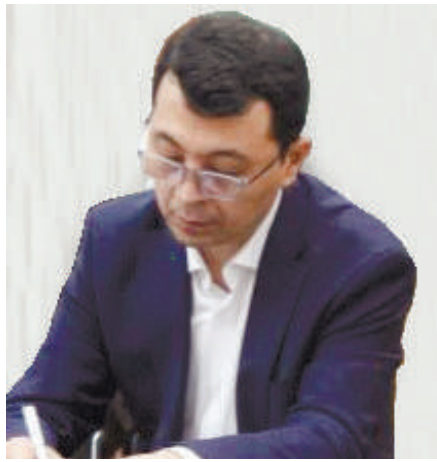
Бахтиёр ИСМОИЛОВ, Олий суд судьяси

Шу нуқтаи назардан, давлат харидлари жараёнида қонунбузилишларнинг олдини олиш мақсадида Ҳазначилик мутахассисларини харидлар режасини шакллантириш ва эълоҳ жойлаштириш босқичларига кузатувчи сифатида жалб этиш таклиф этилади. Бу ёндашув тизимни фақат яқуний босқичда эмас, балки бошланғич босқичда ҳам назорат қилиш имконини беради. Натижада эҳтимолий хато ва камчиликлар илк босқичда аниқланади, шартномаларни бекор қилиш билан боғлиқ ортиқча вақт йўқотилиши камайдиган давлат маблағларидан самарали фойдаланиш даражаси ошади.