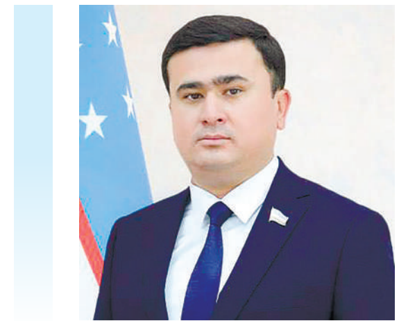
Ойбек ЮЛДАШЕВ, Олий Мажлис Қонунчилик палатаси депутати, O'zLiDeP фракцияси аъзоси

Муаммо кўтариш осон, лекин унга амалий ечим топиш, одамларни рози қилиш катта меҳнат ва машаққат талаб қиладиган жараён ҳисобланади. Шу маънода O'zLiDePнинг "Халқ билан бирга" умуммиллий дастури аҳоли билан давлат ўртасидаги мулоқотни янги сифат босқичига олиб чиқувчи ўзига хос муҳим ҳаётий дастуриламал вазифасини ўташи мумкин. Чунки халқимизнинг сиёсий саводхонлик даражаси, маърифий маданияти тобора ошиб бормоқда. Демак, сиёсий куч аъзолари ҳам фақат амалий ишлари билангина ўз нуфузи, ўрнини мустаҳкамлаши аён.