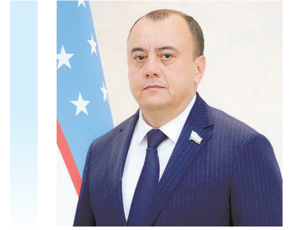
Одилжон МАМАДАЛИЕВ, Олий Мажлис Қонунчилик палатаси депутати, O'zLiDeP фракцияси аъзоси

Гувоҳи бўлганимиздек, O'zLiDePнинг шу ойнинг илк ҳафтасида старт берилган "Халқ билан бирга" дастури доирасида юртимиз бўйлаб "Фаровон оила" акциясини ўтказиш режалаштирилмоқда. Табиийки, бу ташаббус навбатдаги оддий тадбирлардан эмас, балки одамлар билан юзма-юз мулоқотлар воситасида турли кўринишдаги муаммоларга имкони борича шу жойнинг ўзиде ечим топиш ва оилаларни ҳар жиҳатдан қўллаб-қувватлашга қаратилган кенг қамровли ҳаракатлар харитасидир.