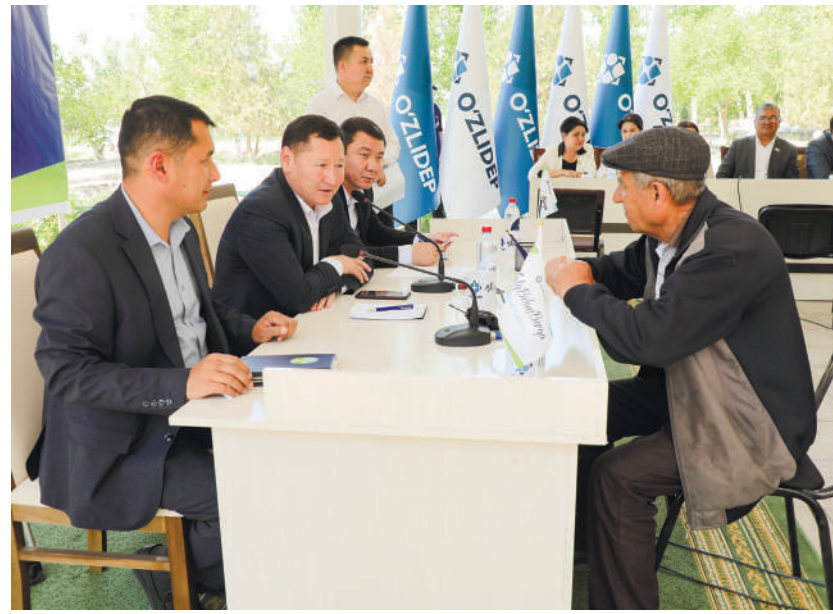
Жумабой ЖАББОРОВ, Қорақалпоғистон Республикаси Жўқорғи Кенгеси депутати:

Партия депутатлари, мутасадди ташкилот раҳбарлари ва кенг жамоатчилик вакиллари иштирок этган тадбир давомида фуқаролардан 100 га яқин муносабат қабул тушди ва энг муҳими, уларнинг 50 дан ортиғи жойида ижобий ҳал этилди.