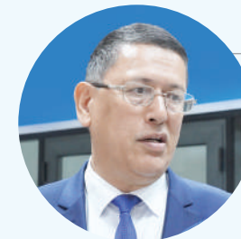
Минходжиддин МИРЗО, первый заместитель председателя Союза писателей Узбекистана

У меня возникает твердая уверенность: в ближайшие годы для молодежи Узбекистана практически не останется такого вида спорта, в котором она не сможет покорить самые высокие вершины. Потому что по инициативе Президента в разных сферах создаются именно такие объекты — современные, продуманные, отвечающие высоким