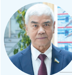
Абдусайд КУЧИМОВ, генеральный директор Национального информационного агентства Узбекистана (Uza), сенатор

Карши — один из древнейших городов Центральной Азии. В разные времена он был известен под именами Бола, Нахшаб, Насаф и, наконец, Карши. Историки говорят как минимум о 2700-летней истории этого города, хотя его корни, возможно, уходят еще глубже — в глубины тысячелетий.