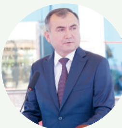
Муротжон АЗИМОВ, хоким Кашкадарьинской области

По инициативе уважаемого Президента и при участии Федерации профсоюзов Узбекистана в Карши построен и введен в эксплуатацию современный Дворец водных видов спорта, соответствующий международным требованиям.