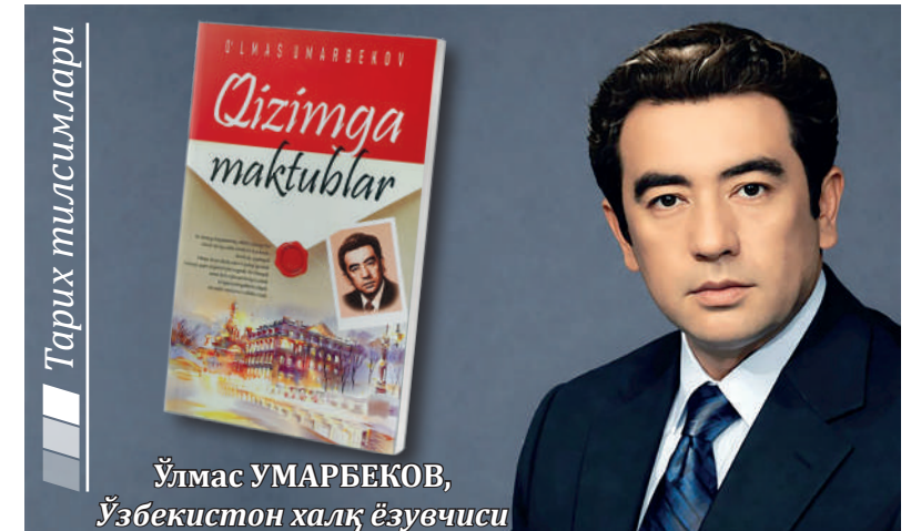
Ўлмас УМАРБЕКОВ, Ўзбекистон халқ ёзувчиси