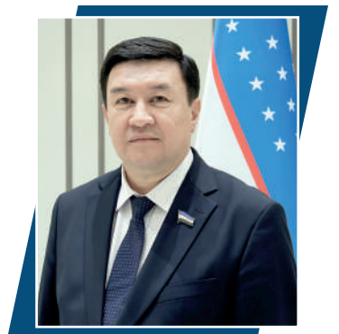
Анвар ТҮЙЧИЕВ, Олий Мажлис Сенати Аграр, сув ҳўжалиги масалалари ва экология кўмитаси раиси

Ҳуқуқий демократик давлат барпо этиш жараёнида қонун устуворлиги ва жамоат тартибини таъминлаш муҳим вазифалар сирасига қиради. Бу борада Маъмурий жавобгарлик тўғрисидаги кодекс алоҳида ўрин тутаяди. Зеро, ушбу кодекс жамиятда ҳуқуқбузарликларнинг олдини олиш, фуқароларнинг ҳуқуқ ва эркинликларини ҳимоя қилиш ҳамда давлат органлари фаолиятини тартибга солишда муҳим ҳуқуқий механизм сифатида хизмат қилмоқда.