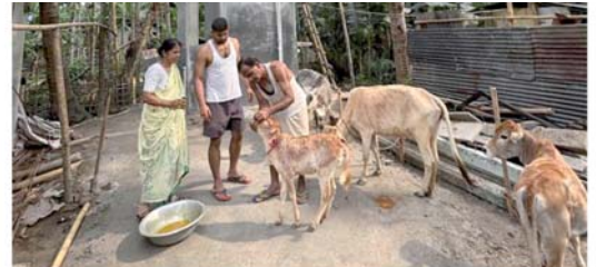
India's harvest festivals under climate strain

Журналисты показали положение фермеров, которые сталкиваются с нестабильностью урожая и ростом издержек, растущее социальное напряжение.