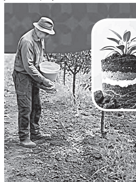
ning ekologik ta'siri jiddiy muammolarni keltirib chiqarmoqda. Plastik materiallar tuproqda uzoq yillar davomida parchalanmaydi, natijada atrof-muhit ifloslanadi. Qolaversa, ko'chatlarni ochiq yerga ko'chirish jarayonida idishdan ajratish vaqtida ildiz qismining shikastlanishi ham kuzatiladi. Bu esa o'simlikning yangi sharoitga moslashishini qiyinlashtirib, rivojlanishiga salbiy ta'sir ko'rsatadi.

Bugungi kunda bozorda torf yoki kokos tolalaridan tayyorlangan ko'chat idishlari ham mavjud. Biroq qo'y junidan tayyorlanadigan idishlar bir qator jihatlari bilan ulardan farq qiladi. Avvalo, qo'y juni tabiiy issiqlik izolyatori hisoblanadi. Bu xususiyat