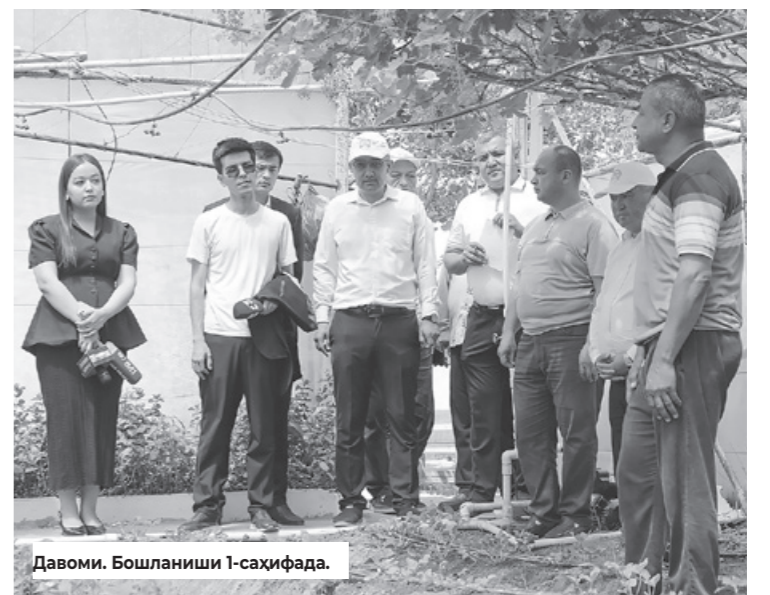
Давоми. Бошланиши 1-саҳифада.