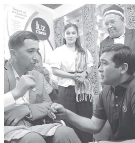
Давоми. Бошланиши 1-саҳифада.

Навбатдаги манзил — Вобкент туманидаги “Чармгарон” маҳалласи бўлди. Бу ерда нурунийлар, сектор раҳбарлари ва “еттилик” аъзолари билан мулоқот ўтказилди. Сўхбат давомида маҳалла худудиде барпо этилаётган Ёшлар маркази йиғит-қизлар учун кенг имкониятлар яратиши таъкидланди. Шунингдек, “Кумак” лойиҳаси, ёшларни хорижга ишга юбориш тажрибаси, чет тилларини ўқиш, шахмат ва ахборот технологиялари маркази ҳамда ҳайдовчилик курслари фаолияти юзасидан тайёрланган тақдиротлар билан танишилди.