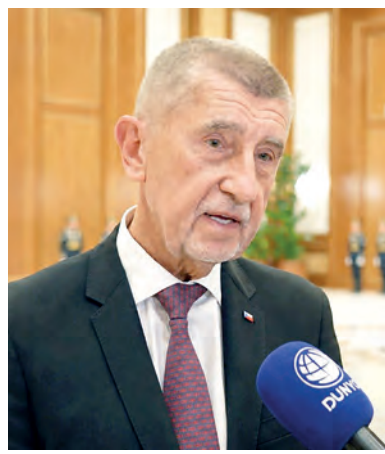
Президента, в которой обозначены все потенциальные направления сотрудничества.

Сожалею, что не был здесь во время своего первого срока на посту Премьер-министра в 2019 году, поскольку затем последовали два года пандемии COVID, и мы потеряли время. Но сейчас готовы двигаться вперед. Получил содержательную книгу от вашего