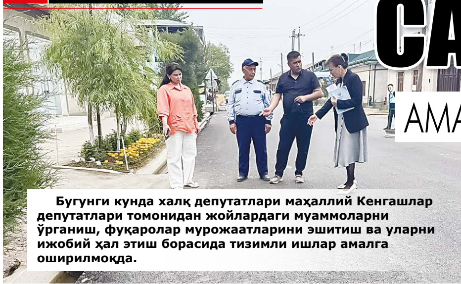
Бугунги кунда халқ депутатлари маҳаллий Кенгашлар депутатлари томонидан жойлардаги муаммоларни ўрганиш, фуқаролар мурожаатларини эшитиш ва уларни ижобий ҳал этиш борасида тизимли ишлар амалга оширилмоқда.

Айниқса, йўл, ичимлик суви, сўғориш тармоқлари, электр таъминоти, ижтимоий соҳа ва инфратузилма билан боғлиқ масалалар юзасидан юборилаётган депутатлик сўровлари ҳудудлардаги кўпжа муаммоларнинг ҳал этилишига хизмат қилмоқда. Бу эса аҳоли турмуш шароитини яхшилаш, фуқароларнинг давлат ва жамиятга бўлган ишончини мустаҳкамлашда муҳим аҳамият касб этмоқда.