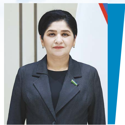
Малика ҚОДИРХОНОВА, Олий Мажлис Сенати аъзоси.

Маълумки, Оила кодексининг 15-моддасида никоҳ ёши ўн саккиз ёш эканлиги, узрли сабаблар бўлганда, алоҳида ҳолларда никоҳга киришни хоҳловчиларнинг илтимосига кўра, туман (шаҳар) ҳокими никоҳ ёшини кўпи билан бир йилга камайтириши мумкинлиги кўрсатилган.