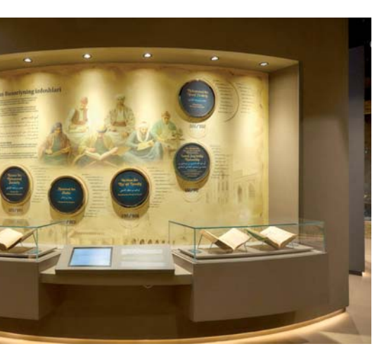
Здесь можно увидеть авторитетный в исламском мире орден «Имам Бухари», подаренную комплексу королем Саудовской Аравии кисву — часть покрывала Каабы.

Завершая экспозицию интерактивные материалы, посвященные значению наследия Имама Бухари для современных поколений, о религиозно-образовательных реформах, осуществленных в Узбекистане в годы независимости.