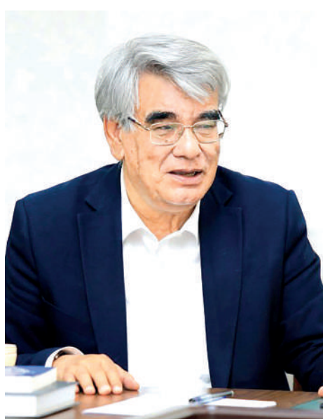
Usmon AZIM, O'zbekiston xalq shoiri