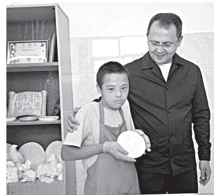
Тошкент вилояти ҳокимлиги Ахборот хизмати

Бу чора-тадбирлар болаларнинг мустақил ҳаётга тайёргарлигини кучайтириш ва жамиятда муносиб ўрин эгаллашига хизмат қилиши таъкидланди.