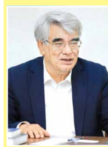
Усмон АЗИМ, Ўзбекистон халқ шоири