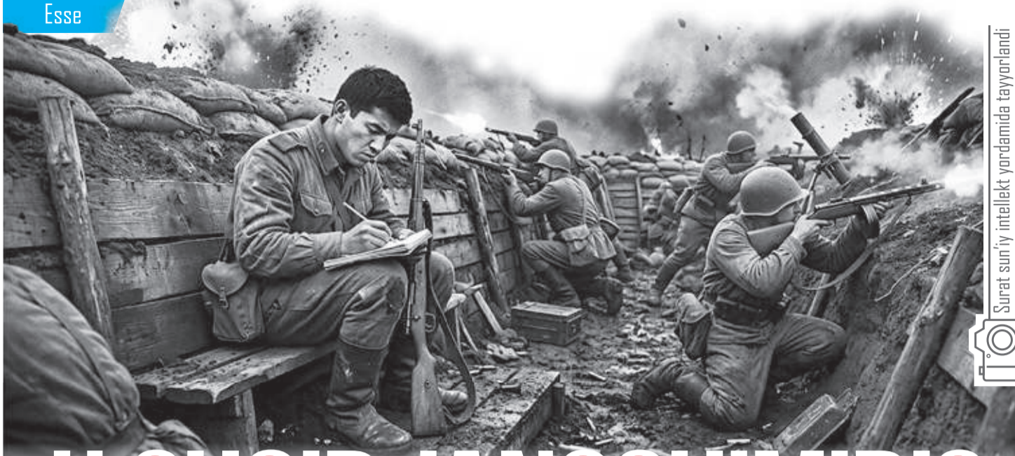
Surat sun'iy intellekt yordamida tayyorlandi