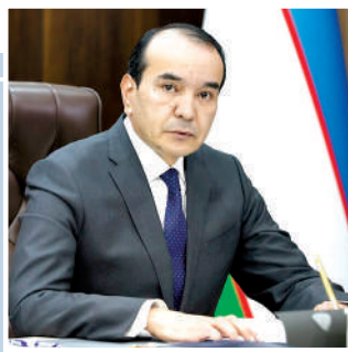
Ozodbek NAZARBEKOV, O'zbekiston madaniyat vaziri:

— Bugun o'zbek futbolida adolat qaror topdi desak, menimcha, eng to'g'ri gap bo'ladi. Chunki davlatimiz rahbarining o'zi bu masalaga shaxsan kirishdi. Mana, alohida e'tiborning katta natijasini ko'rib turibmiz. Demak, adolat bor joyda yoshlarimiz hech kimdan kam emasligini bemalol namoyon eta oladi. O'g'il-qizlarimiz sport, kitobxonlik sharofigidan uyli va mashinali bo'lyapti. Futbolchilarimizni jahon chempionatiga kuzatish oldidan o'ta xayrli loyiha — milliy kitobxonlik harakati boshlab yuborildi. O'ylaymanki, bu ezgu ish kelajagimiz vorislari hayotida g'oyat muhim o'rin tutadi. Zero, yonib turgan ko'zlariga umid, ishonch berish, tayanch bo'lish o'zbek yoshlarini shijoatlantiradigan, birlashtiradigan muhim omil desak, xato bo'lmaydi. Bu sa'y-harakatlar zamirida esa, eng avvalo, yoshlarga e'tiborning davlat siyosati darajasiga ko'tarilishi, alohida mehr-muhabbat turibdi.