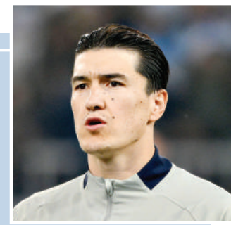
Eldor SHOMURODOV, futbol bo'yicha O'zbekiston milliy terma jamoasi sardori:

— Tarixiy musobaqa oldidan o'tgan uchrashuv biz, futbolchilarni kuchli hayajonga soldi. Prezidentimizga terma jamoamizni alohida qo'llab-quvvatlab, ruhlantirgani uchun cheksiz minnatdorlik bildirdik.