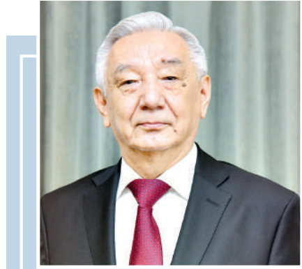
Mirzo-Ulug'bek ABDUSALOMOV, O'zbekiston Respublikasi Konstitutsiyaviy sudi raisi, O'zbekistonda xizmat ko'rsatgan yurist