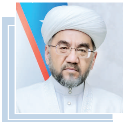
Shayx Nuriddin XOLIQAQZAR, O'zbekiston musulmonlari idorasi raisi, muftiy