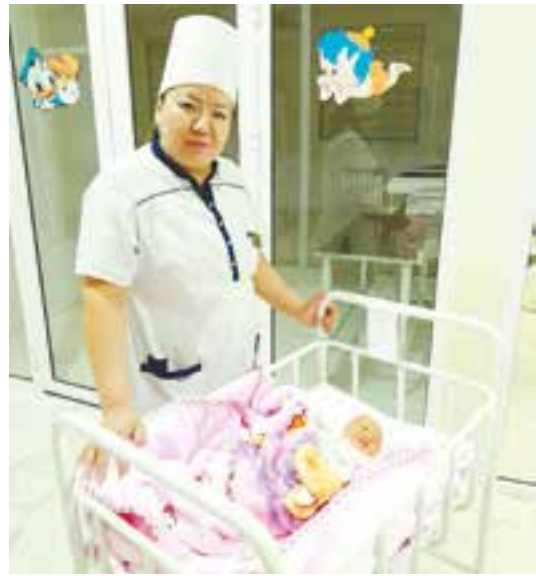
a'zolari nazariga tushdi.

Bugun Samarqand shahrida mana shunday tirishqoq, o'z ustida doimiy ishlaydigan hamshiralari soni tobora ko'paymoqda. Ular orasida Samarqand shahar sog'liqni saqlash bo'limi tasarrufidagi 3-tug'ruq majmuasi 1-doyalik bo'limining doimiy xodimlari ham shu islohotlar bilan qadamba-qadam yurishlari shart va zarur.