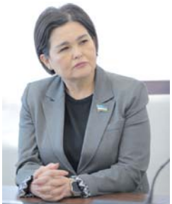
Надира РАШИДОВА, депутат Законодательной палаты Олий Мажлиса.

Важно, что в постановлении делается акцент на политических принципах строительства социального государства. Такие традиции Курбан хайита, как поддержка нуждающихся в помощи, проявление внимания и заботы о каждом человеке, служат источником силы и вдохновения.