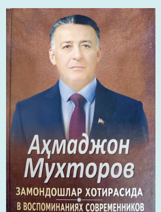
ЗАМОНДОШЛАР ХОТИРАСИДА В ВОСПОМИНАНИЯХ СОВРЕМЕННОИКОВ

Китоб журналистика тарихи билан қизиқувчи ўқувчиларга, тадқиқотчиларга, талабаларга, шунингдек, миллий матбуотнинг кечаги ва бугунги тақдирига бефарқ бўлмаган кенг китобхонлар оммасига мўлжалланган.