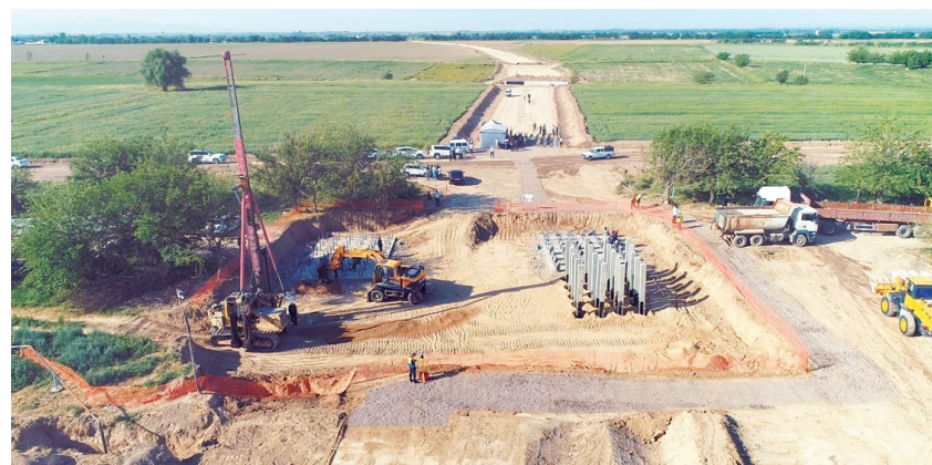
Тошкент вилоятида транспорт инфратузилмасини тубдан яхшилаш, ҳудудлар ўртасидаги иқтисодий ва ижтимоий алоқаларни мустахкамлашга қаратилган яна бир йирик стратегик лойиҳага шарт берилди. Тошкент — Сирдарё темир йўлининг рамзий қозғи қоқилишига бағишланган тадбир Нурафшон, Пискент, Бўка, Бекобод, Бобёвут ва Янгйер йўналишидаги ҳудудларни қамраб олиб, Тошкент ва Сирдарё вилоятлари ўртасидаги транспорт алоқаларини янги босқичга олиб чиқиши кутилаётган темир йўл тармоғининг қурилишини бошлаб берди.