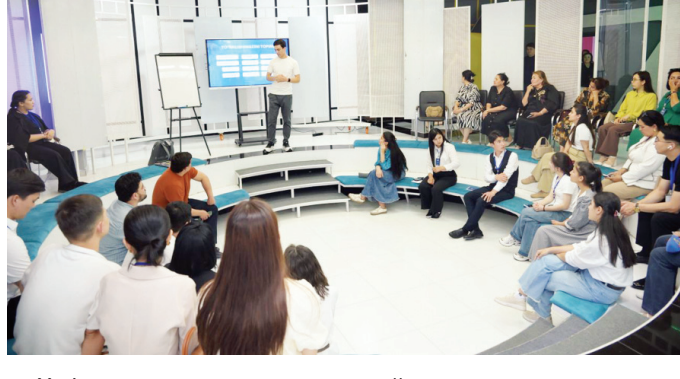
«Дунё» АА. Вашингтон

Бундан ташқари "ахборотни кутиш эмас, уни шакллантириш" тамойили устуворлик қилди.