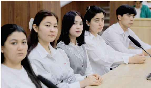
Учрашувда ёшларни қизиқтирётган долзарб масалалар, аграр

Олий Мажлис Сенатининг Аграр, сув ҳўжалиги масалалари ва экология қўмитаси ташаббуси билан Тошкент давлат аграр университетига “Сенатор ва ёшлар” учрашуви ташкил этилди. Унда қироличлар, талабалар, ёш олимлар ҳамда оммавий ахборот воситалари ходимлари қатнашди.