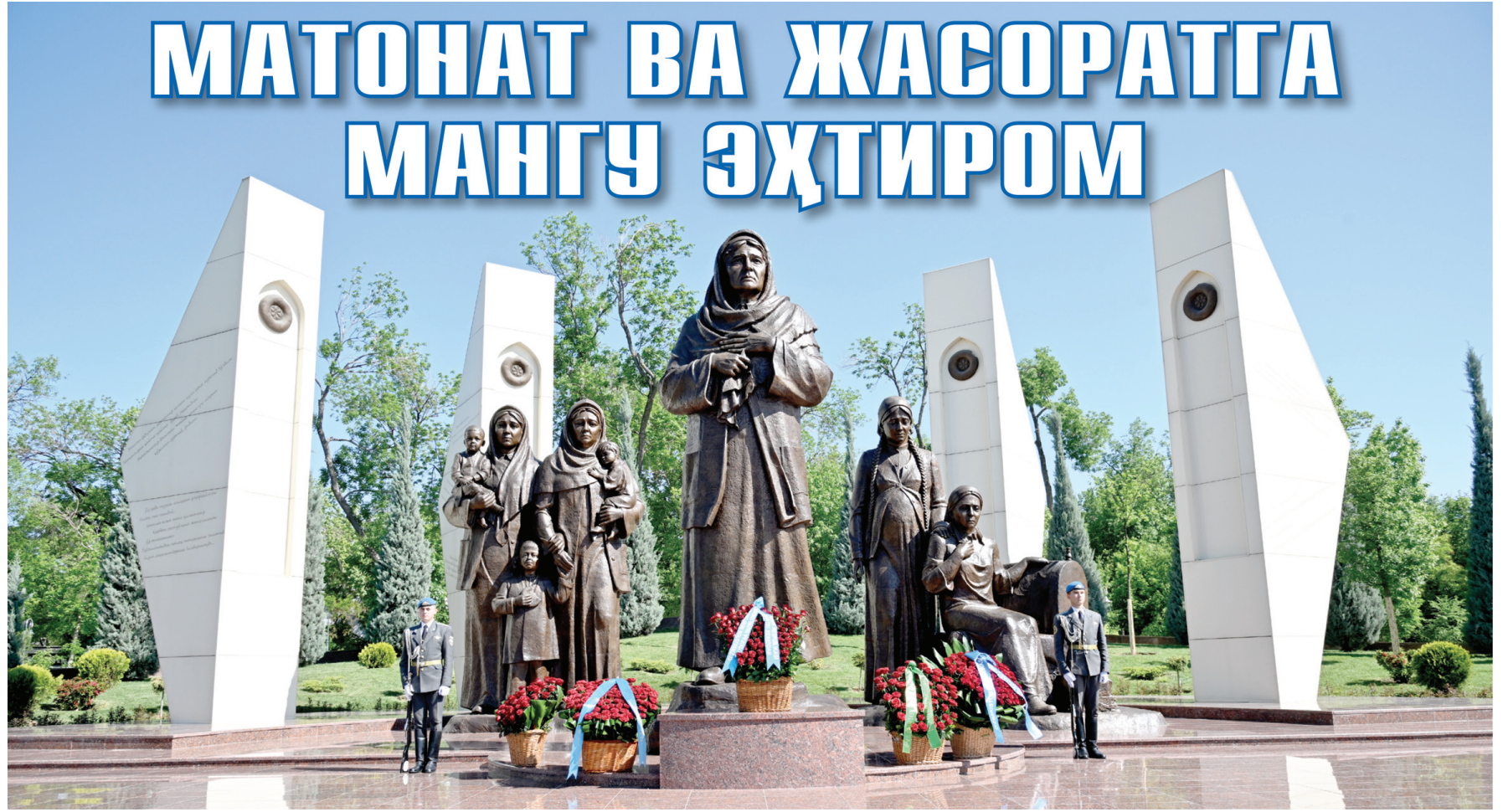
Мамлакатимизда Хотира ва Қадрлаш куни ҳамда Иккинчи жаҳон урушида қозонилган Ғалабанинг 81 йиллиги кенг нишонланди. Президентимиз Шавкат Мирзиёевнинг Ўзбекистон халқига йўллаган табиғий байрам шуқуҳини янада оширди.