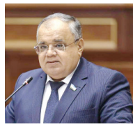
булган минглаб оилалар турибди. Зотан, иқтисодий ўсиш фақат одамларнинг ҳаётини яхшилашдангина ҳақиқий маъно касб этади.

Бу ҳамкорликнинг аниқ натижалари фуқароларнинг кундалик ҳаётида ҳам аққол сезилмоқда. Хусусан, ўзаро ишонч асосида йўлга қўйилган ҳамкорлик натижасида 1 400 километрдан ортиқ темир йўл ва 1 700 километр автомобиль йўллари модернизация қилинди. 4 минг километр сув таъминоти тармоқларида ишлар якунланиб, 750 га яқин таълим муассас-