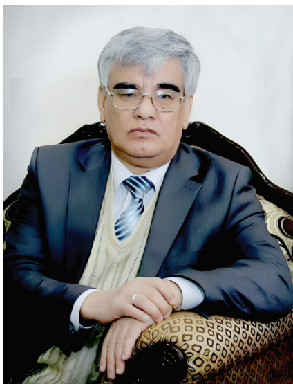
Усмон АЗИМ, Ўзбекистон халқ шоири

Худода минг шўқрим, бу ўзгаришлар ҳар соатда, ҳар кун рўй бериб турибди. Бутун мамлакат ҳаракатда. Энг муҳими, бу ислохотлар жайдарни тўсда эмас, балки жаҳоннинг энг илғор технологиялари асосида олиб борилмоқда. Шароитлар яратилгани тўғрисида инвестициялар бемалол кириб келяпти. Ривожланиш шиддати бутун мамлакатни қамраб олган.