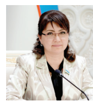
Унда бажарилган ишлар чуқур таҳлил қилиниб, мавжуд муаммолар очик қўрсатилди ва ўрнини бартараф этиш бўйича аниқ чора-тадбирлар белгилаб берилди. Мазкур ёндашув соғлиқни сақлаш тизимини қисқа муддатли эмас, балки узоқ истиқболга мўлжалланган ҳолда қайта шакллантиришга қаратилгани билан аҳамиятлидир.

Яқинда Президентимиз Шавкат Мирзиёев раҳбарлигида ўтказилган соғлиқни сақлаш тизимини такомиллаштиришга қаратилган тақдимот соҳада туб ўзгаришларни амалга оширишга хизмат қиладиган, аниқ мақсад ва механизмларга асосланган стратегик дастур сифатида алоҳида аҳамият касб этади.