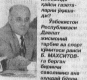
Б. МАХСИТОВ Давлат жисмоний тарбия ва спорт кўмитаси раиси