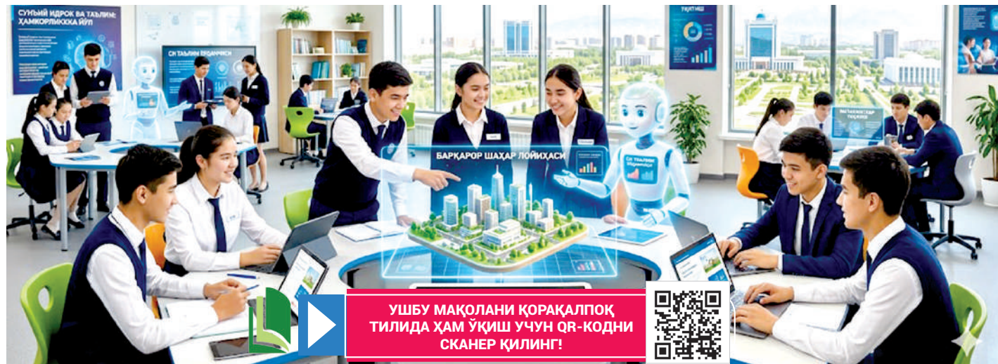
УШБУ МАҚОЛАНИ ҚОРАҚАЛПОҚ ТИЛИДА ҲАМ ўқиш учун QR-КОДИ СКАНЕР ҚИЛИНГ!

Дунё улкан бурилиш палласида. Ўн йиллар аввал илмий лабораториялар доирасидагина тилга олинган, оддий инсон учун ақл бовар қилмайдиган сунъий интеллект технологиялари ҳаётимизни мутлақо янги ўзанга буриб юборди. Кундалик турмушимизнинг энг оддий жараёнларига қадар кириб борди. Баъзан сезмаймиш ҳам, масалан, тонда гаджетимиздаги хабарлар тартибланиши, навигаторнинг тирбандликни ҳисобга олиб йўл тавсия қилиши ёки интернет платформаларининг қизиқишларга мос ахборотларни тақдим этиши ортида мураккаб алгоритмлар ва интеллектуал тизимлар ишламоқда.