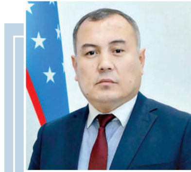
Азамат КАМОЛОВ, Мақтабгача ва мақтаб таълими вазирлиги бошқарма бошлиғи

Тараққиётга эришган барча жамиятлар, аввало, интеллектуал юксалиш босқичидан ўтган. Юқори мутолаа маданияти инсонда танқидий фикрлашни шакллантиради, дунёқарашни кенгайтиради, мустақил қарор қабул қилиш ва билим олиш қобилиятини оширади. Китобхон жамият радикализи, ахборот манипуляцияси ва ижтимоий таназулга камроқ мойил бўлади. Зеро, китоб нафақат билимли инсонни, балки етук фуқарони ҳам тарбиялайди.