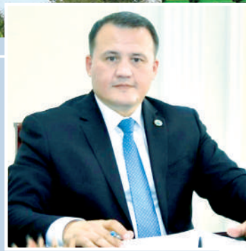
Актам ҲАЙТОВ, Ўзбекистон фермерлари кенгаши раиси