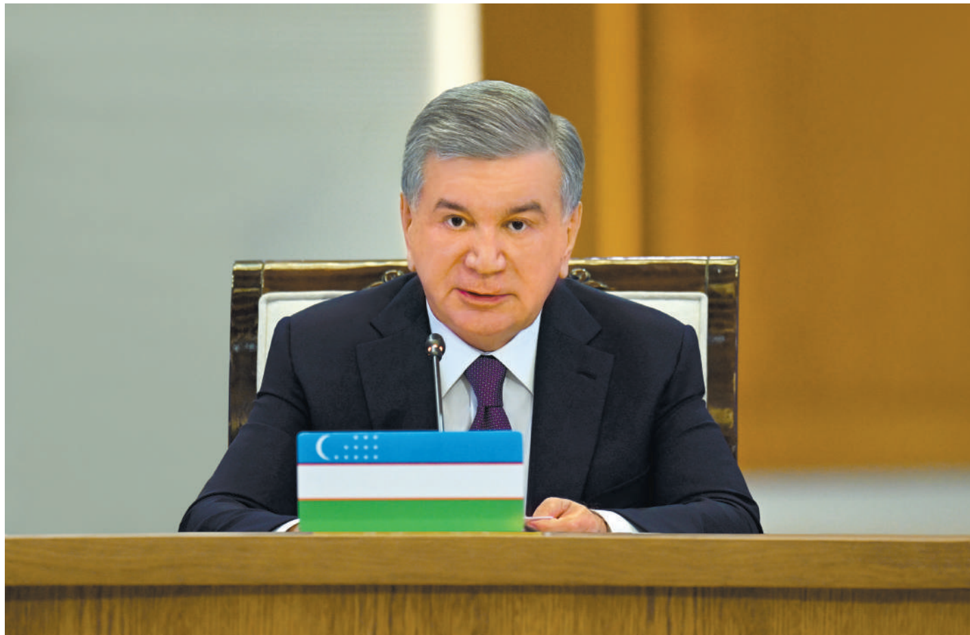
Қозоғистон Республикаси Президенти Қосим-Жомарт Тоқаев раислигида ўтган учрашувда Беларусь Республикаси Президенти Александр Лукашенко, Қирғиз

Ўзбекистон Республикаси Президенти Шавкат Мирзиёев 29 май куни Остона шахрида Олий Евроосиё иқтисодий кенгашининг навбатдаги йиғилишида кузатувчи давлат раҳбари мақомида иштирок этди.