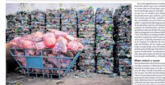
Con el Sistema de Tareas de Responsabilidad (SRI) de España, el consumidor paga por adelantado el precio del reciclaje.

переработки и увеличить долю повторного использования материалов. Экологические организации подчеркивают, что переработка сама по себе не является универсальным решением и главной задачей должно оставаться сокращение потребления одноразовой упаковки.