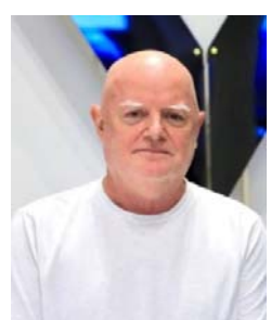
Клад ГАСКОН, генеральный директор Глобального экологического фонда:

Согласно экспертным оценкам, проведение форума в Узбекистане стало признанием возрастающей роли страны и всего региона Центральной Азии в продвижении глобальной экологической и климатической повестки.