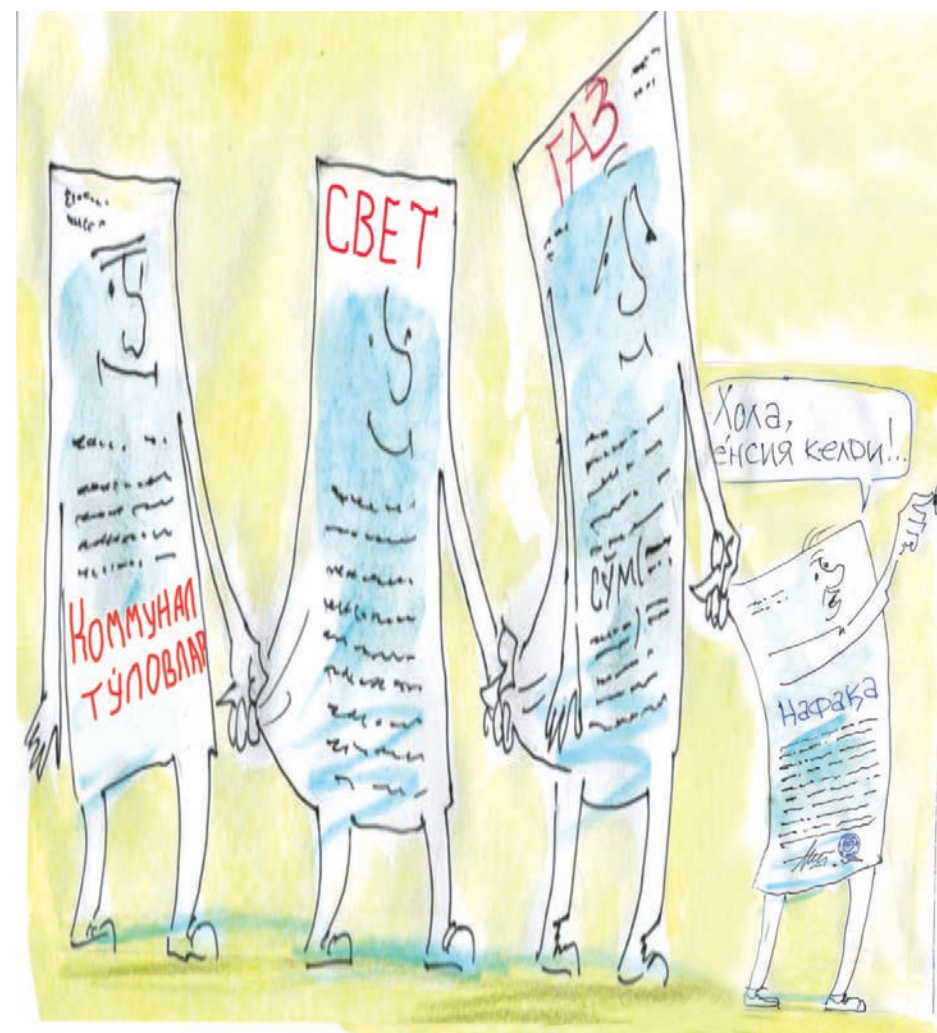
Хусан СОДИҚОВ чизган карикатура.