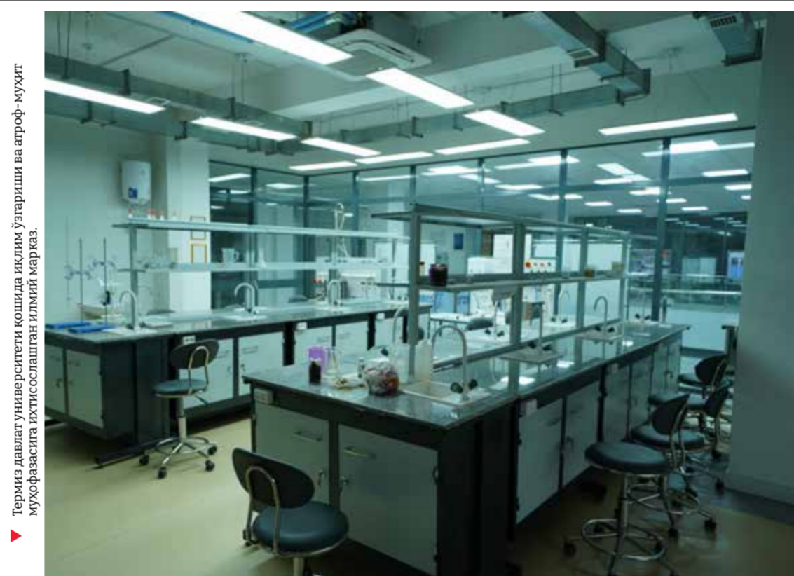
Термида давлат университети қошида иқлим ўзгариши ва атроф-муҳит муҳофазасига ихтисослашган илмий марказ.