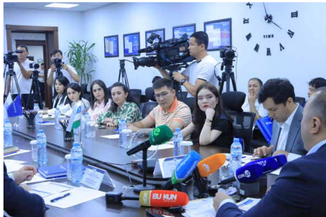
Кўп квартиралар уйлари фойдаланишга қабул қилиш жараёни муҳокама.