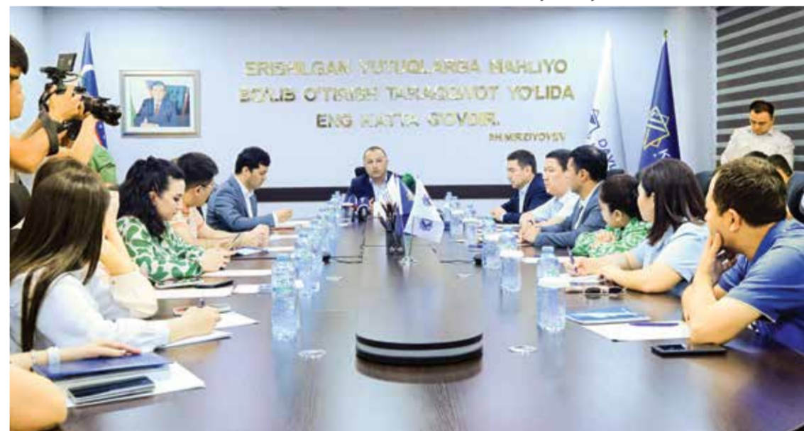
Матбуот анжуманидан лавҳа.

2026 йил 1 июндан бошлаб кўп квартирали уйларни фойдаланишга қабул қилиш, кадастр паспортларини расмийлаштириш ва давлат рўйхатидан ўтказиш жараёнлари UZKAD ахборот тизими орқали амалга оширилади.