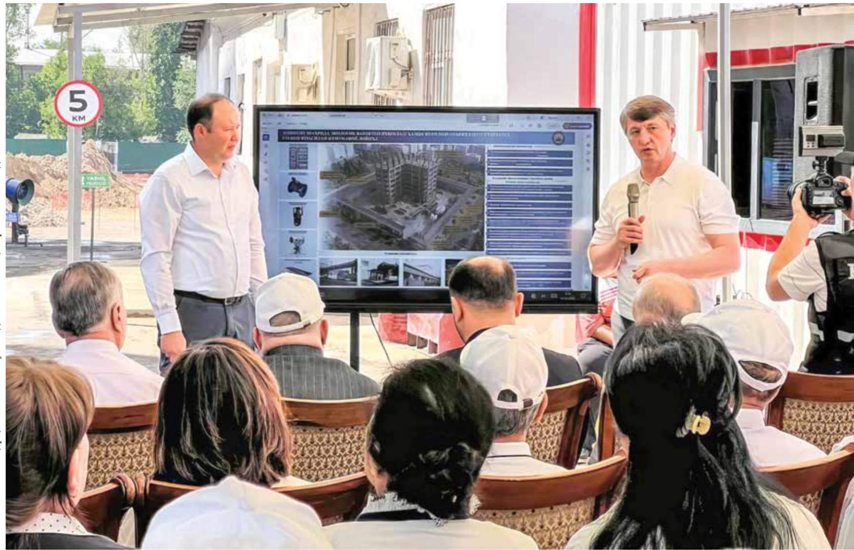
Тошкент шаҳар ҳоқими Учтепа туманидаги янги лойиҳалар билан таъминлади.

Учтепа туманидаги Тошкент шаҳар 3-сон болалар клиник шифохонасида бўлиб ўтган тадбирда соғлиқни сақлаш тизимидаги мавжуд муаммолар, оналик ва болаликни муҳофаза қилиш, тиббий муассасаларни замонавий ускуналар билан таъминлаш масалалари муҳокама қилинди. Таъкидланишича, сўнгги беш йил давомида ушбу йўналишдаги қатор муаммолар сезиларли даражада камайган. Шунингдек, тиббиёт муассасалари учун 56 турдаги 81 та замонавий ускуна харид қилингани маълум қилинди.