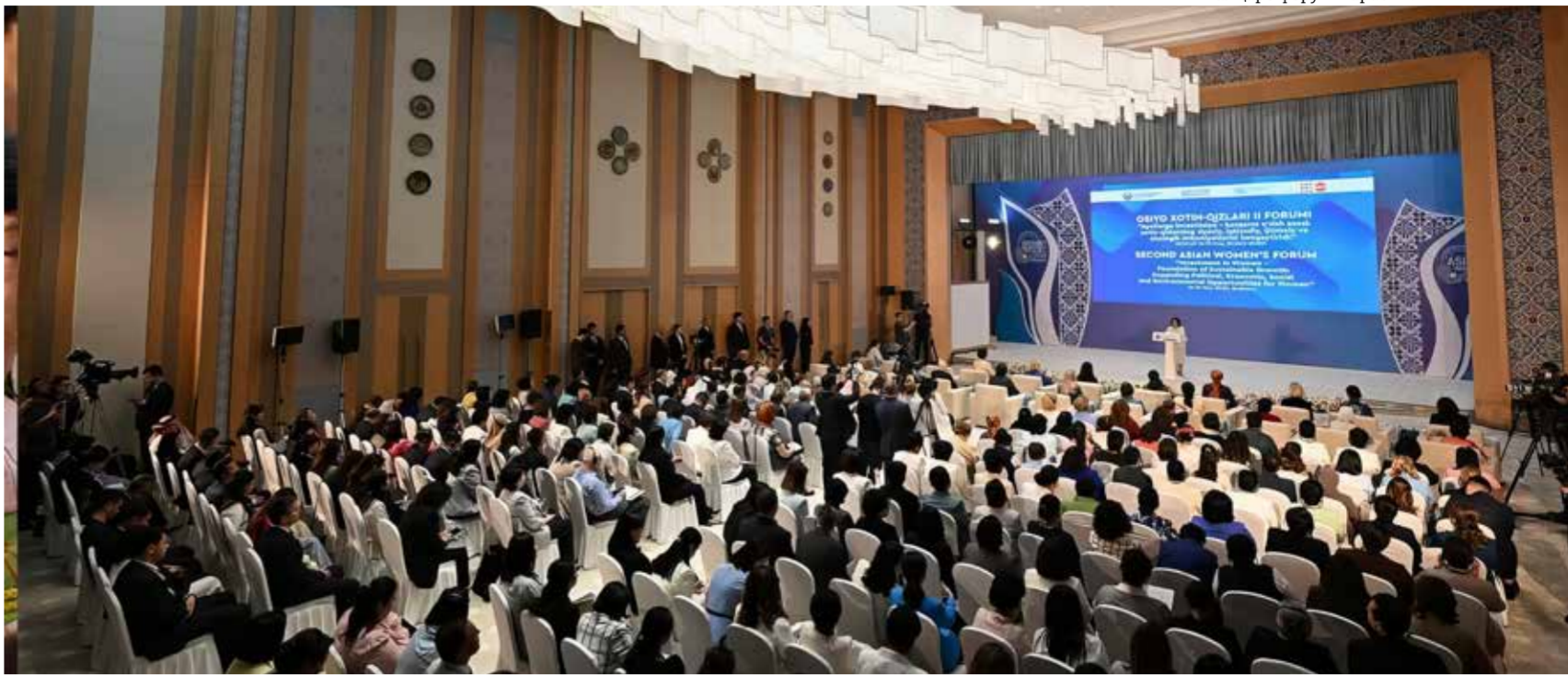
Халқаро форум жараёни.

Тадбир давомида АҚШ элчихонаси вакиллари жорий йилда АФСР томонидан Регистон билан боғлиқ яна бир йирик лойиҳа амалга оширилишини билдирди. Яъни маданий мерос ва инновацион рақамли технологияларни бирлаштирган 'Абадий Регистон' лойиҳаси яратилди. Мазкур лойиҳада АҚШ ишлаб чиқилган сунъий интеллект ва виртуал реаллик воситаларидан фойдаланиб, Регистоннинг 3D рақамли моделлари яратилди ҳамда улар орқали мажмуа бўйлаб виртуал саёҳатларни амалга ошириш ва таълим йўналишларида фойдаланиш мумкин бўлади.