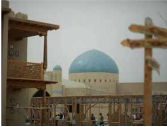
▼ “Арда Хива” туристик мажмуаси.