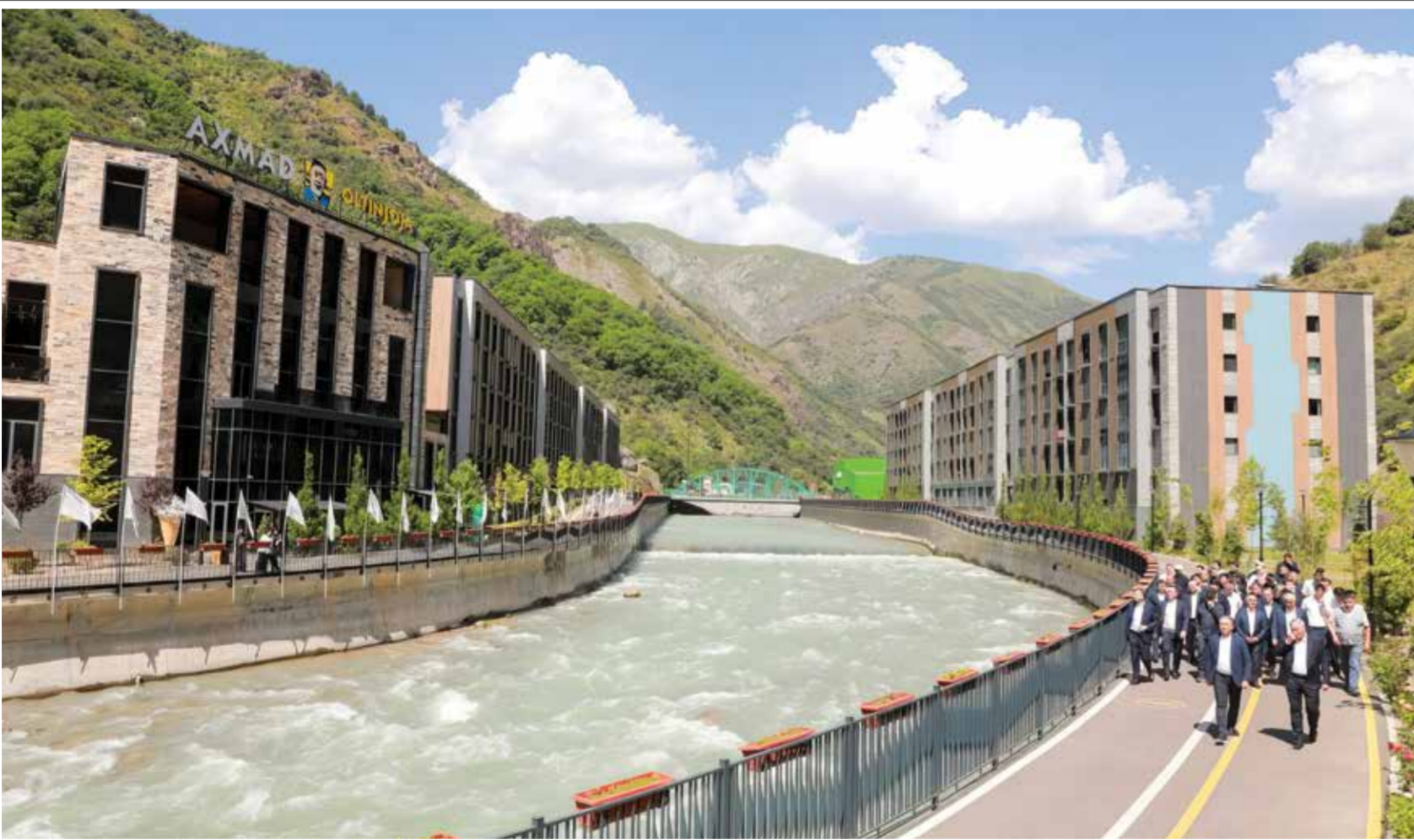
Угам Ривер Маркази.