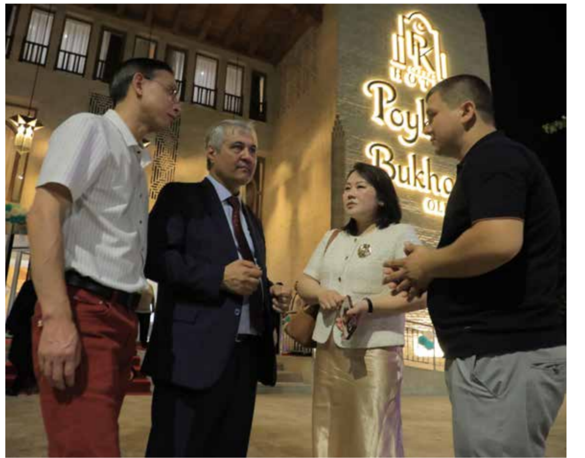
▲ Бухоро шаҳрида “Poyleft Bukhara Old City” меҳмонхонаси фойдаланишга топширилди.

Меҳмонхонанинг ишга туширилиши Бухоронинг халқаро туризм бозоридagi рақобатбардошлигини янада ошириш, зиёрат туризми имкониятларини кенгайтириш ва вилоят иқтисодига қўшимча инвестициялар жалб этишга хизмат қилади.