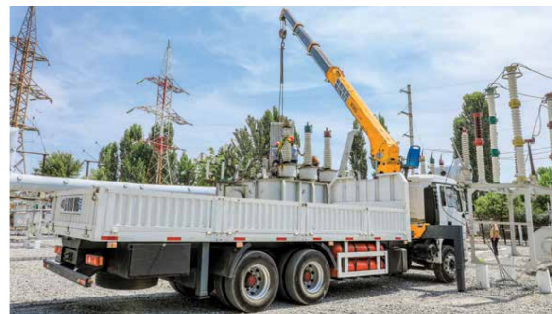
Фарғона вилояти Тошлоқ туманидаги Дехқонобод подстанциясида муҳим аҳамият касб этмоқда.

Мутахассислар таъкидлашча, мазкур модернизация лойиҳаси худуднинг ижтимоий-иқтисодий ривожланишига хизмат қилиш баробарида, вилоят энергетика тизимининг барқарорлигини таъминлашда ҳам муҳим аҳамият касб этади.