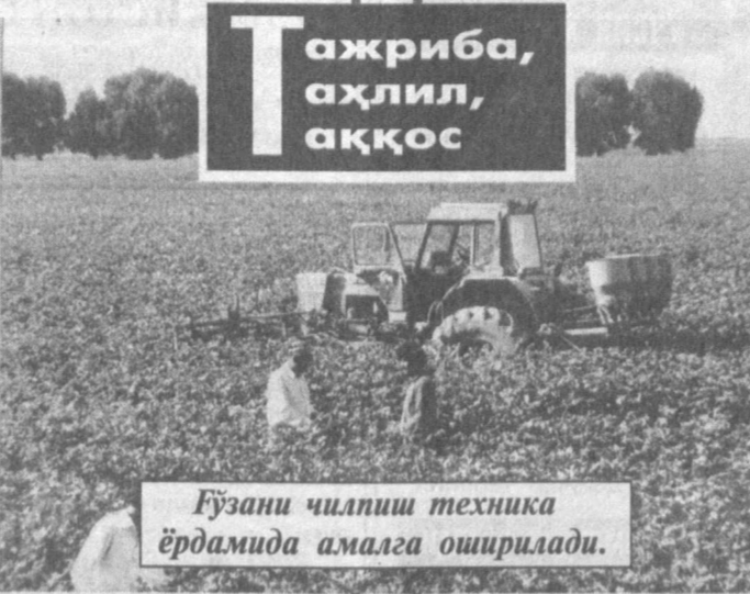
Ўзани чилпиш техника ёрдамида амалга оширилади.

Кимки элим деб, юртим деб, елса, югурса, жон қойитса, билинги, бундай одам ҳеч қачон ўз ишидан қониқмайди. Бугун кечаги-