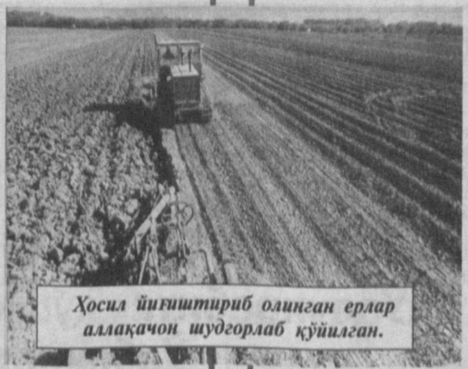
Ҳосил йиғиштириб олинган ерлар аллақачон шудгорлаб қўйилган.

— Унда розиман. Ҳақиқатан ҳам, кейинги йилларда «Жейнов»нинг қиёфаси кескин ўзгарди. Тор ва эгри-бугри кўчалар кенгайтирилиб, икки тарафда қиройли иморатлар қурилди. Хонадонлар газлаштирилиб, водопровод қувурлари ўрнатилди. Айна пайтда газлаштириш 95 фоизни, ичимлик суви билан таъминлаш 96 фоизни ташкил қилмоқда. Хўжаликнинг шифонаси ҳам бор. Мактаблари замонавий, мактаб-интернатнинг доврўги эса чор-атрофга кетган. Бу йил уни битирган 40 нафар ўқувчининг 37 нафари Тошкентдаги энг нуфуз-