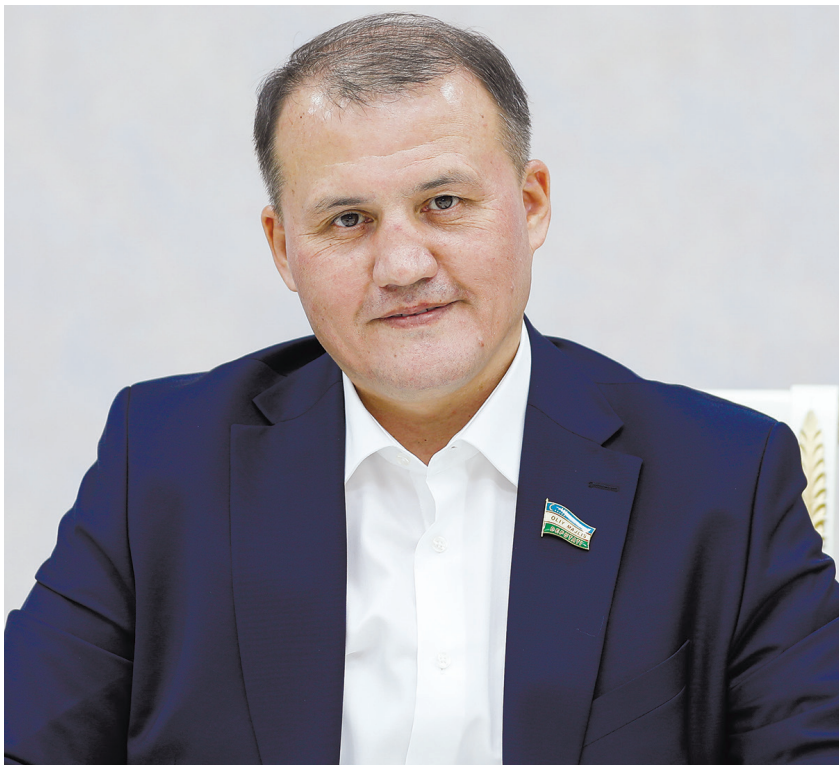
Актам ХАЙТОВ, Олий Мажлис Қонунчилик палатасидаги O'zLiDeP фракцияси раҳбари

Бугун Ўзбекистон ўз тараққиётининг янги босқичга кириб бормоқда. Мамлакатимизда иқтисодий либераллаштириш, хусусий мулкни мустақам химоя қилиш, тадбиркорликни қўллаб-қувватлаш, инвестиция муҳитини яхшилаш ва глобал иқтисодий тизимга чуқур интеграциялашишга қаратилган кенг кўламли ислохотлар изчил давом этмоқда. “Ўзбекистон – 2030” стратегиясида белгиланган мақсадлар ҳам айнан шу йўналишдаги амалий ҳаракатларни янги босқичга олиб чиқишни тақозо этмоқда.