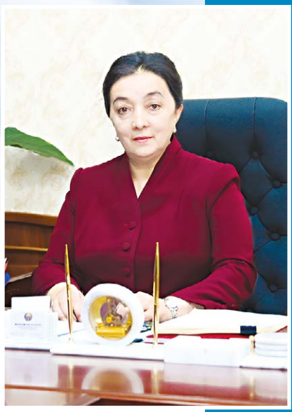
Зулхайо МАХКАМОВА, Ўзбекистон Республикаси Бош вазири ўринбосари – Оила ва хотин-қизлар қўмитаси раиси.