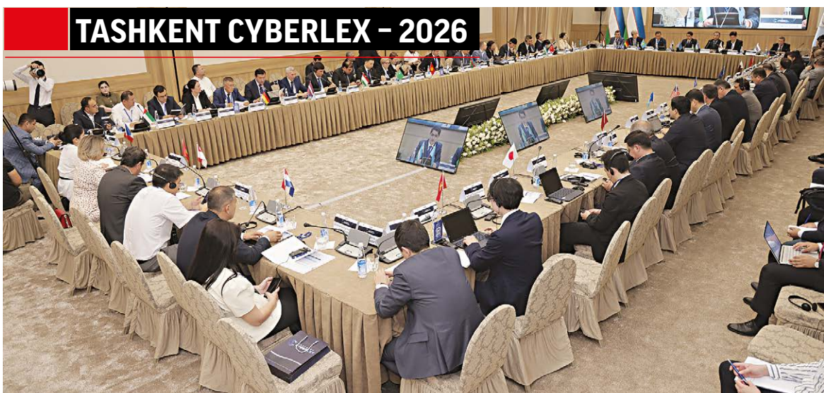
TASHKENT CYBERLEX - 2026

Бу нафақат ўқитувчининг обрўсига, балки бутун таълим муҳитига ҳам таъсир қилади. Шу сабабли ҳар бир ўқувчи ўз ҳаракати учун масъул эканини