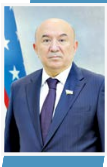
Равшан ФОЗИЛОВ, Олий Мажлис Қонунчилик палатаси депутати

бизнес субъектлари учун солиқ режимини янада қулайлаштириш, қўшилган қиймат солиғи маъмуриятчилигини соддалаштиришга қаратилгани билан аҳамиятлидир.