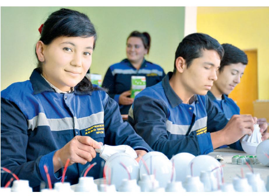
2 триллион сўмлик солиқ қарзларининг бекор қилиниши тадбиркорлар учун катта энгиллик бўлди.

Айниқса, микробизнес учун ягона 4 фойзлик айланма солиғи жорий этилиши, ҚҚС ставкаси 12 фойзга туширилиши ва