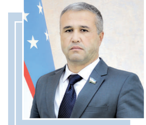
Раҳматилло ШУКУРОВ, Олий Мажлис Қонунчилик палатаси депутати

Бугунги хонадонни 20-30 йил аввалги уй билан таққослаб бўлмайди. Илгари бир уйда бир телевизор, бир музлаткич ва бир неча чироқ бўлган, ҳозирда деярли ҳар хонадонда кондиционер, компьютер, кир ювиш машинаси, микротўқилки печ ва ўнлаб электрон қурилмалар ишлайди.