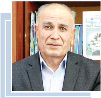
АХТАМҚУЛИЙ, Ўзбекистон Ёзувчилар уюشمаси аъзоси, шоир