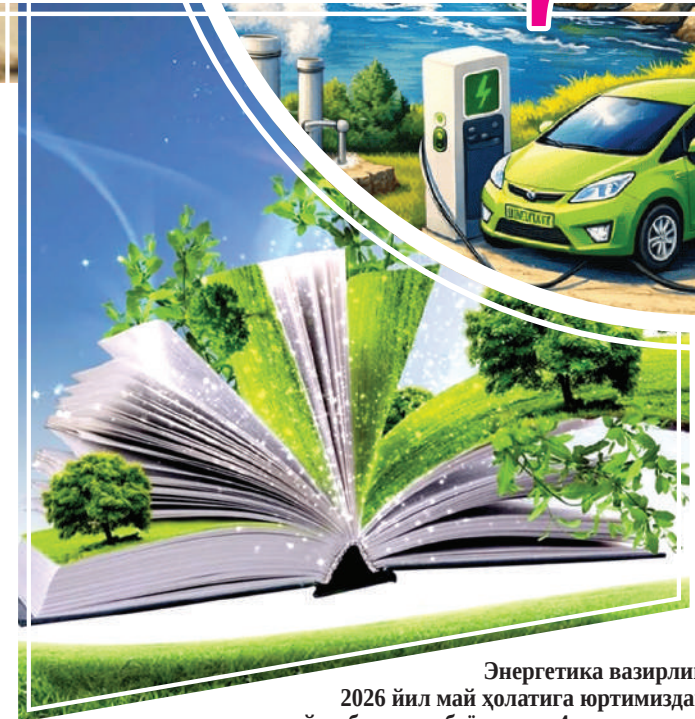
Энергетика вазирлиги маълумотларига кўра, 2026 йил май ҳолатига юртимиздаги қуёш ва шамол электр станциялари томонидан йил бошидан буён жами 4 миллиард кВт. соат электр энергияси ишлаб чиқарилди. Шундан 2 миллиард 315 миллион кВт. соат қуёш фотозлектр станциялари, 1 миллиард 685 миллион кВт. соат эса шамол электр станциялари ҳиссасига тўғри келади.

Ўзбекистон учун ҳам экологик барқарорлик масаласи стратегик аҳамият касб этади. Орол денгизи фожиаси, сув ресурслари