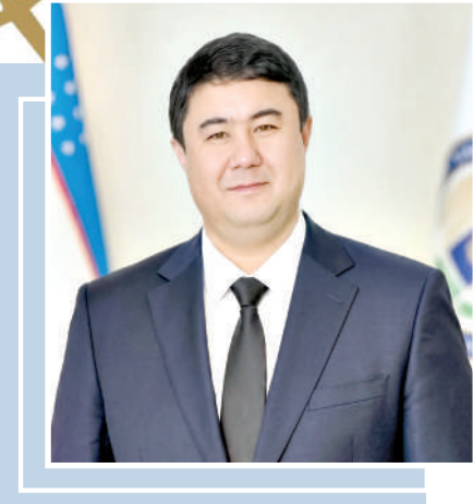
Музаффар ЭРКИНОВ, кинорежиссёр