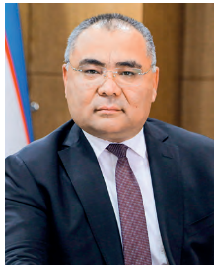
Иброхим Абдурахмонов. Министр сельского хозяйства Республики Узбекистан, академик.

или О «перевернутой» системе аграрной науки, объединяющей гранты, ученых, домохозяйства, фермеров и рынок