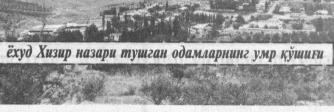
Ёхўд Хизир назари тушган одамларнинг умр кўшиги

бунун Қашқадар дехқонларини синовдан ўтказган қийинчиликлар биз касбиликларнинг ҳам четлаб ўтмади. Аммо бугунги зафар марраминики эгаллашда асосий сабаб бўлган бир иккита омилларни алоҳида таъкидлаб ўтмоқчиман. Биринчиси шўки, бу йил вилот ҳокимининг шахсий ташаббуси ва тadbirkорлиги билан савдон оқилона ва тежамли фойдаланиш шариоти яратилди. Хар бир пайкал бошида қурилган сув ўлчагичлар ва, айниқса, хар бир дехқонда пайдо бўлган маъсуляти — хар қатла об-ҳаводан самарали фойдаланиш имконини яратди. Касбилик асл дехқонлар яшайди. Уларнинг узоқ йиллик дехқончилик таъриблари иккинчи омил бўлди, десам янглишмайман.