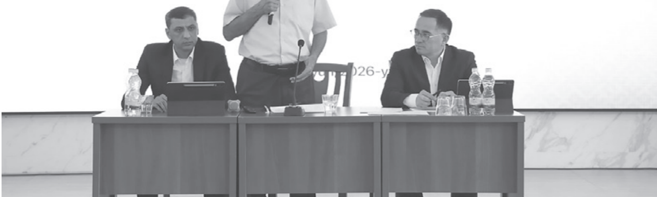
Давоми. Бошланиши 1-саҳифада.

TOSHKENT SHAHRIDAGI MAHALLA RAISLARI UCHUN TASHKIL ETILGAN O'QUV-SEMINARIGA XUSUSIY KETIBSIZ