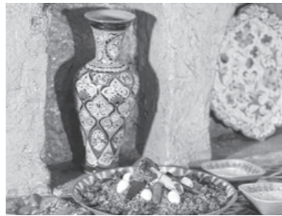
Девзирадан тайёрланадиган АНДИЖОН ПАЛОВИ географик кўрсаткич сифатида рўйхатга олинди.