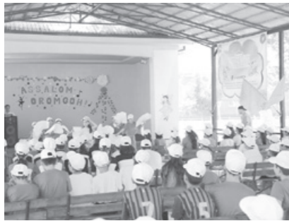
ОТА-ОНА ҚАРАМОҒИДАН МАҲРУМ БЎЛГАН БОЛАЛАР оромгоҳларда бепул дам олади.