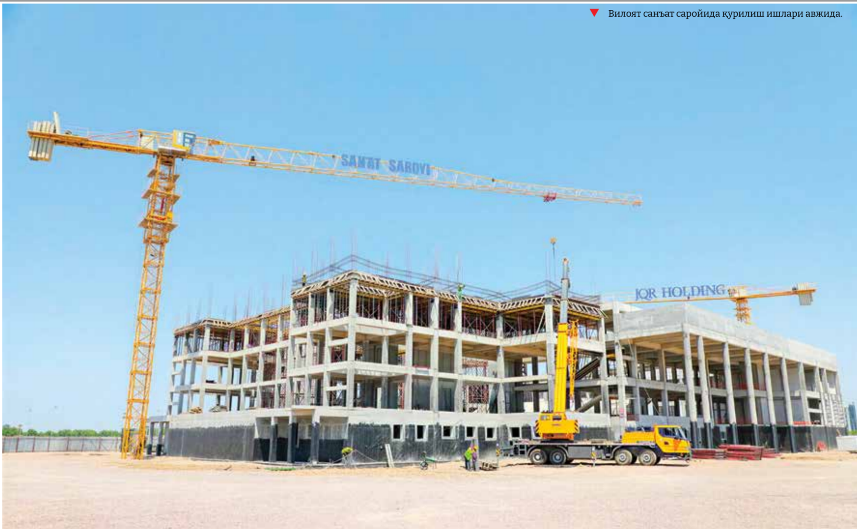
Вилоят санъат саройида қурилиш ишлари авжида.

Таъкидланганидек, "Nurafshon Business City" келгусида давлат идоралари, таълим ва тибби- ёт муассасалари, маданият ва хизмат кўрсатиш объектларини бирлаштирган замонавий иш- билармонлик ва жамоат марказига айланиши кўзда тутилган. Лойиҳанинг амалга оширили-